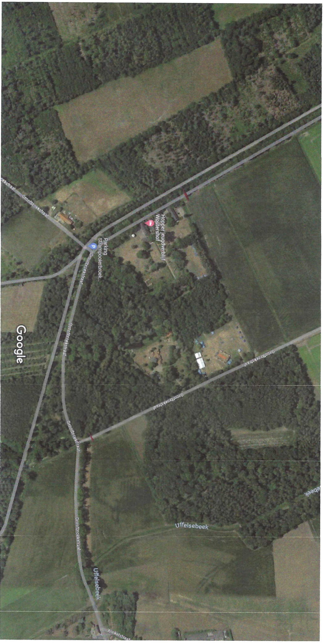
50 m